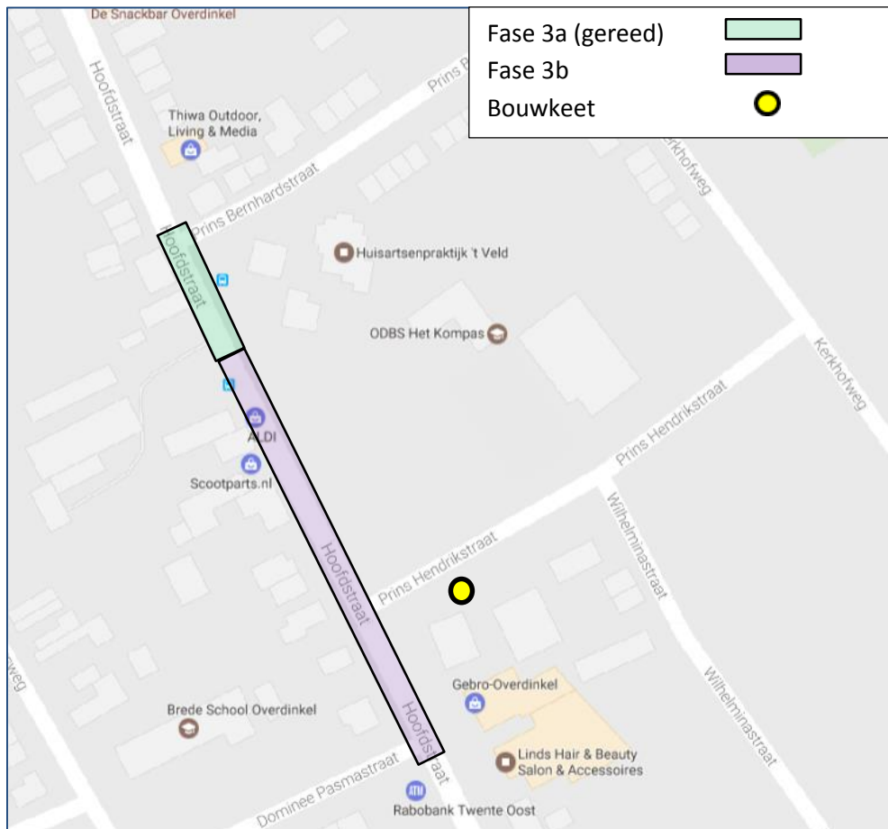
Figuur: Overzicht fase 3a en 3b