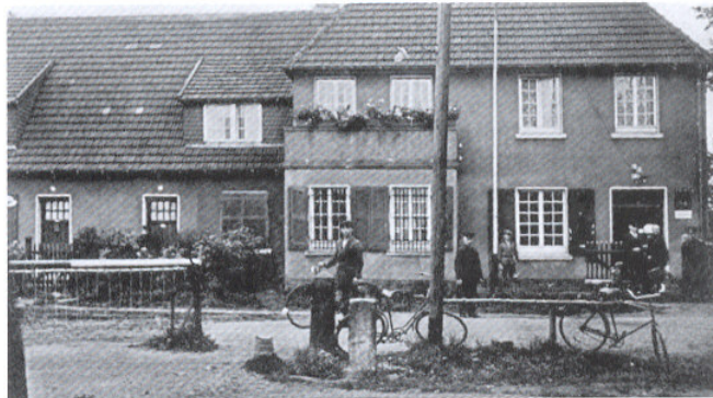
De grensovergang Tiekkerhook in Overdinkel.

Op deze plaats moet gewezen worden op het merkwaardige feit, dat velen van de oudere textielarbeiders in Losser en Overdinkel - evenals in Glanerbrug en Enschede - die voor de Enschedese fabrieken vaak weinig goede woorden over hebben, met heimwee terugdenken naar de tijd voor de laatste oorlog waarin zij aan de overzijde van de grens werkten. Overdinkelse textielarbeiders verzekerden ons, dat van deze categorie zeker 34 weer naar Gronau zou willen terugkeren als dit mogelijk was. Van de (thans) in Enschede woonachtige vroegere "grensgangers" zou wel de helft willen terugkeren. Hetzelfde zou gelden voor voormalige grensarbeiders van Denekamp, Ootmarsum etc., die voorheen in Nordhorn werkzaam zijn geweest.