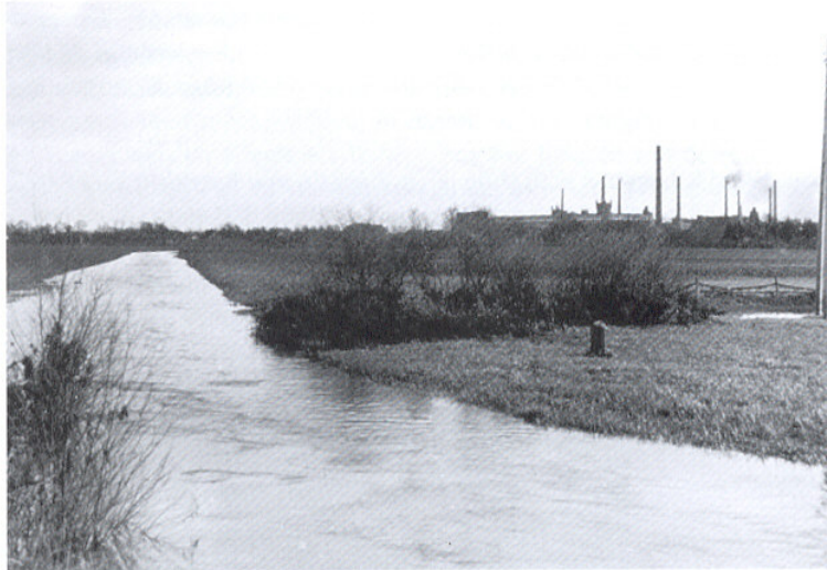
Gezicht op de rokende fabrieksschoorstenen van het Duitse Gronau, ca 1920.

Een groot deel van de Hollandse immigranten heeft zich metterwoon in Gronau gevestigd. Een ander deel ging op Hollands grondgebied wonen op het Losserse Veld, de onbewoonde heidestrecken over de Dinkel in het gezicht van de Duitse fabrieken. De overigen vestigden zich in of nabij het dorp Losser. Een aantal hunner heeft eerst in Duitsland gewoond maar is daarna naar Hollands grondgebied verhuisd, omdat daar de levensstandaard lager was, goedkopere grond ter beschikking stond en de kinderen Nederlands onderwijs konden krijgen. In de verslagen van de staatscommissie van 1890 heet het reeds, dat er veel volk uit Drenthe, Friesland en Steenwijkerwold enz. naar de gemeente Losser trekt en bij de Pruisische grens op Hollands grondgebied in keten woont doch ook reeds dat er behoorlijke woningen voor hen worden gebouwd. Dikwijls gingen enkele "kwartiermakers" vooruit, die voor henzelf en hun familieleden werk zochten en in de huisvesting voorzagen (aanvankelijk inwoning en keten). Wanneer de verdiensten een tijd lang hadden gevloeid, werd goedkope grond gekocht waarop een huisje werd gebouwd.