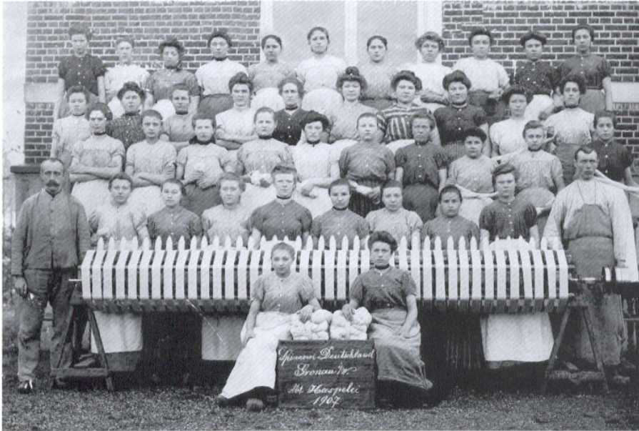
Deze bijzonder fraaie foto uit 1907 toont personeel van de Spinnerei Deutschland in Gronau. Deze fabriek was gevestigd direct over de grens bij de overgang Glane. Volgens mensen die het kunnen weten, zou zeker de helft van de afgebeelde dames afkomstig zijn uit Overdinkel, Glane en Losser.

De bevolking is heterogeen van afkomst, zoals wij reeds zagen. Er is een tamelijk sterke Duitse bijmenging; er zijn in Gronau meer Hollandse mannen met Duitse (ook Beierse) vrouwen getrouwd dan omgekeerd. Ondanks deze etnische en de gebruikelijke politieke en kerkelijke tegenstellingen leeft er toch ook in Overdinkel een zeker gemeenschapsgevoel, hetwelk echter niet zo sterk is dat vreemdelingen, d.w.z. nieuwe import, niet worden opgenomen. Men zegt wel eens, dat als een nieuweling na drie weken nog niet in de Overdinkelse gemeenschap zijn plaats heeft ingenomen, dat dit dan alleen aan hem zelf te wijten is. Het dialect, dat er gesproken wordt, doet wel sterk aan het Twents denken maar het bevat veel Friese, Drentse en andere "vreemde" woorden en uitdrukkingen. Dit dialectverschil met het dorp Losser etc. illustreert de zekere afstand, welke Overdinkel als geheel tot de bevolking van Losser voelt. Vele Lossersers zouden nooit in Overdinkel kunnen aarden, het omgekeerde is evenzeer waar. Overdinkel heet nog iets "losser" en "ruwer", zelfs iets meer dan Glanerbrug in de gemeente Enschede welk grensdorp dezelfde geschiedenis als Overdinkel heeft. De Overdinkeler heeft ook dadelijk "veel meer een woord" dan de meeste "Tukkers" (zoals de autochtone Twentenaren wel worden genoemd),