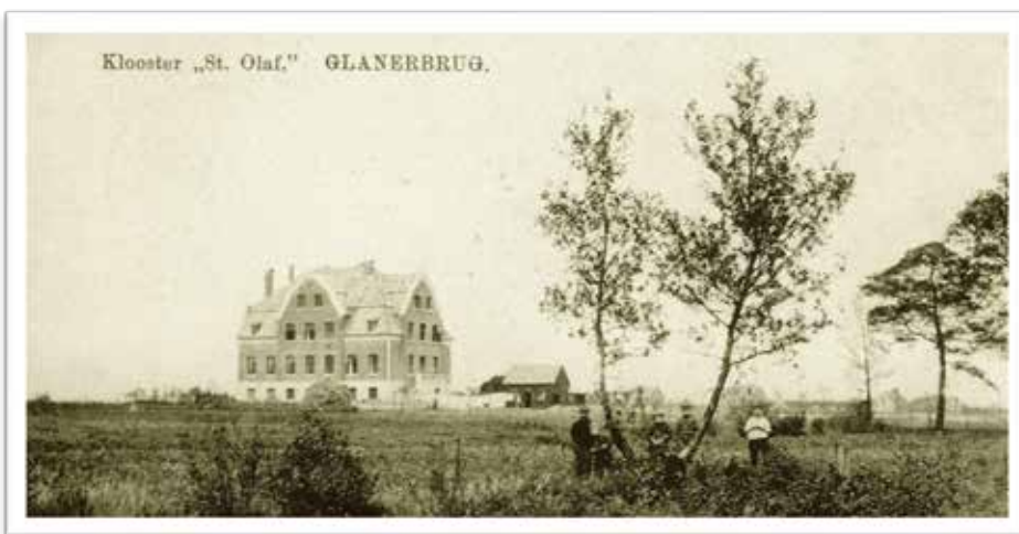
Het St. Olavklooster in Glane, begin 20ste eeuw.