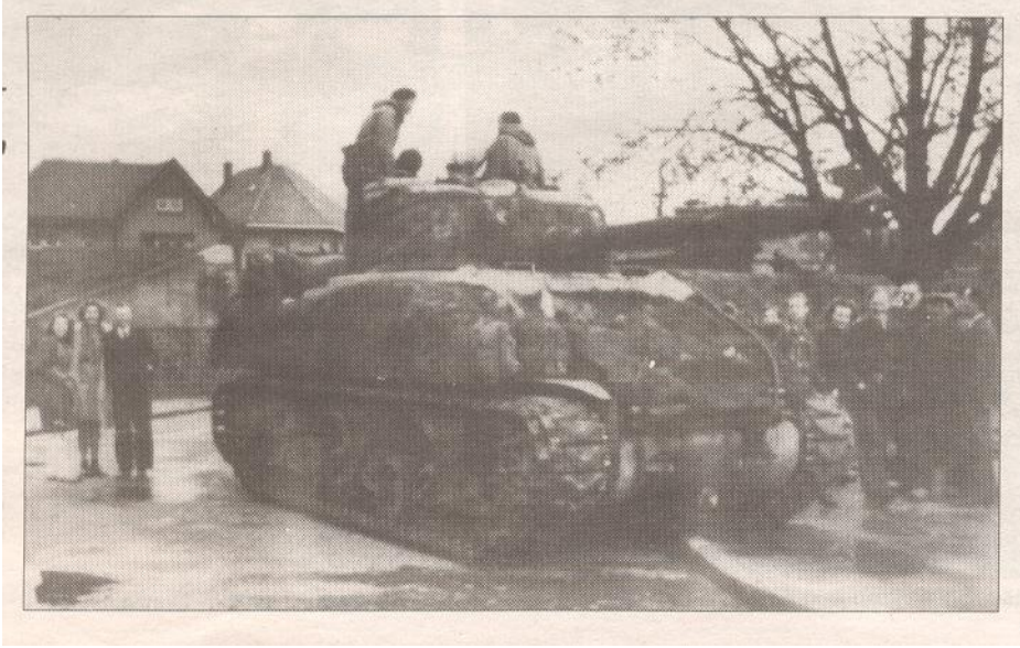
Een Engelse tank.