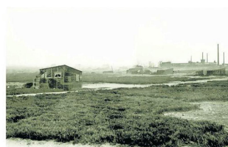
Van het Overdinkelscheveld bestaan voor zover bekend geen foto's. Wel van de contouren van Gronau. Met gebruikmaking van een foto uit Drenthe is getracht om een indruk te geven van hoe het daar toen moet hebben uitgezien.