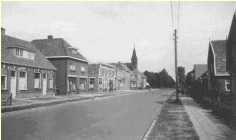
Een nieuwe langgerekt dorp is hier ontstaan: Overdinkel.

Een nieuw, langgerekt dorp is hier ontstaan langs de lijnrechte binnenweg van Losser Zuidoostwaarts naar de grens: Overdinkel. De snelle opbloei van de Gronauer nijverheid trok vele honderden uit de arme streken van de Noordelijke gewesten aan. Zij kwamen uit de kop van Overijssel, uit Stellingwerf, van de Friese heide, later ook uit de Zuidoosthoek van Drente. Velen staken ook de grens over, om zich in of bij Gronau een bestaan te verzekeren. Nagenoeg allen hadden het arm gehad en kwamen hier door de flinke lonen op een voor hen onbekend levenspeil. Gronau's schoorsteenpijpen en massale fabrieksblokken, huizen en torens, op tien minuten of een kwartier afstand van de grens gelegen, ziet men vlakbij, wanneer men zich op Overdinkels gebied bevindt.