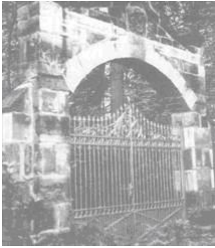
de Bentheimer zandstenen toegangspoort van het 'Gut Ruenberg'