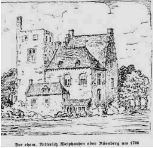
Der ehem. Ritterlich Welphusen oder Ruenberg um 1700

Het voormalige riddergoed Welphusen of Ruenberg omstreeks 1700